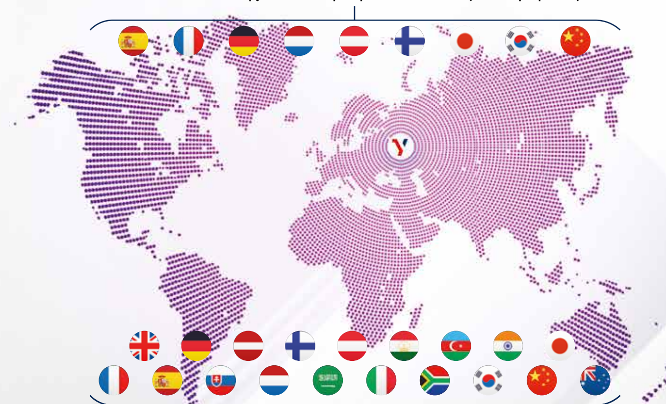
Расширение международного сотрудничества и партнерства в 2020–2021 годах благодаря онлайн-проектам